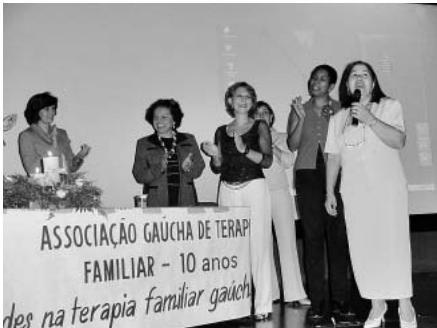
Na hora do parabéns: os 10 anos da Agatef foram comemorados pelos terapeutas presentes em evento realizado no auditório do Banco Central, em Porto Alegre.